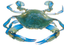
blue crab cangrejo azul

Do not reuse the water used to cook the crab. No use el agua con que cossino el congrejo. Do not eat the tomalley (the green stuff.) No coma el tomalley (la substancia verde)